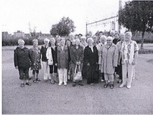
Glada våningsvärdinnor och våningsvärdar en augustimorgon på väg till Sundborn och deras utställning om Karin.

Som ordförande kan jag bara bocka och tacka alla och en var, som bidragit med en fantastisk arbetsinsats under Karin utställningen i Hallsberg. Även hjärtligt tack till dem som inte finns med i bild. Alla var så fina i Karinförkläden och skjortor. Vi har också uppmärksammat att många kvinnor uti landet kommer att sy egna förkläden efter vårt mönster.