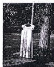
Sy ett förkläde!

21 kassar, 176 Karins receptböcker, 35 Karin förklädesmönster, 48 Vykortstapet samt 18 burkar morotsmarmelad. I utställningsshopen såldes dessutom mycket ur Carl Larssongårdens kollektion.